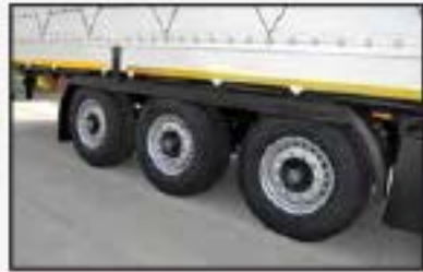
Disk frenli dingiller ve Antisprey çamurluk