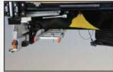
Arka sabit tampon, Stepne taşıyıcı, Takoz, Merdiven