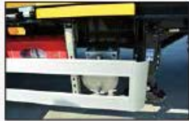
Dengeleme ayağı, Bisiklet korkuluğu Su tankı ve Yangın söndürücü