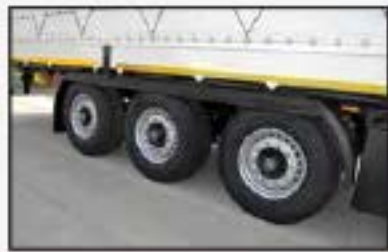
Disc brake axes and Anti-spray mudguard