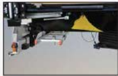
Rear bumper foldable type, Spare tire carrier, Wheelchock, Ladder