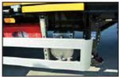
Side underrun guard, Landing gear, Water tank and Fire extinguisher